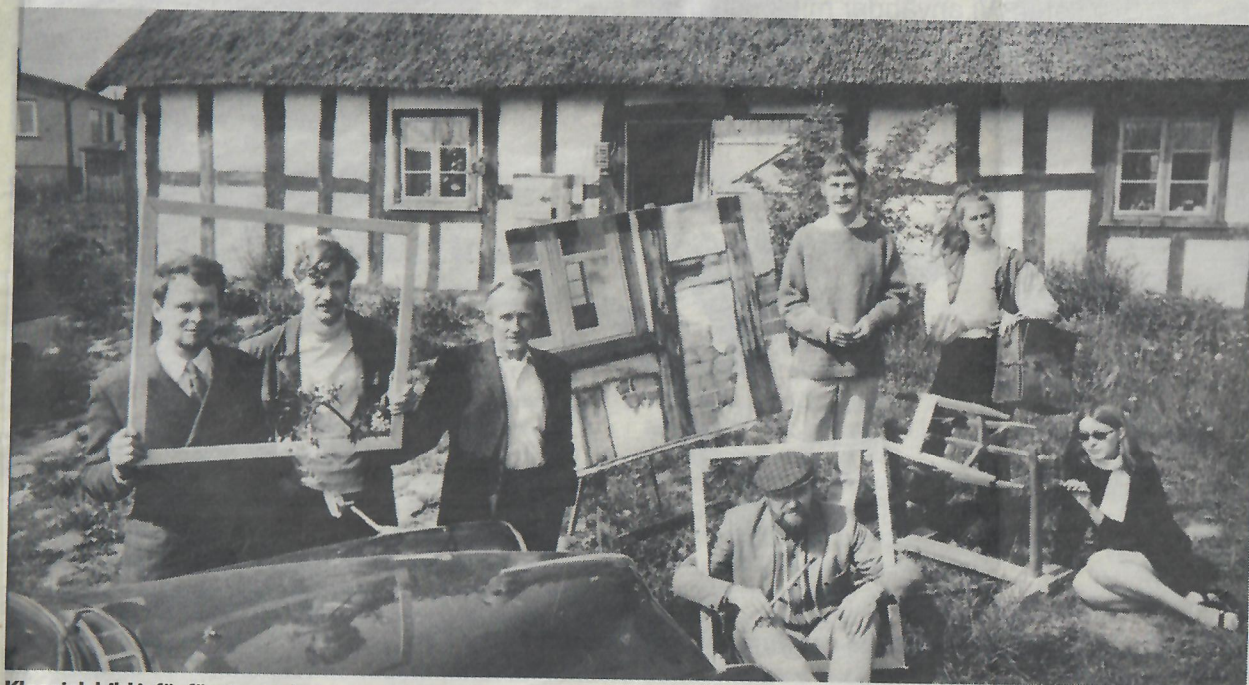
Klassisk bild inför första upplagan av det som idag heter konstrundan. Året var 1968, huset Lusingahuset i Maglehem.