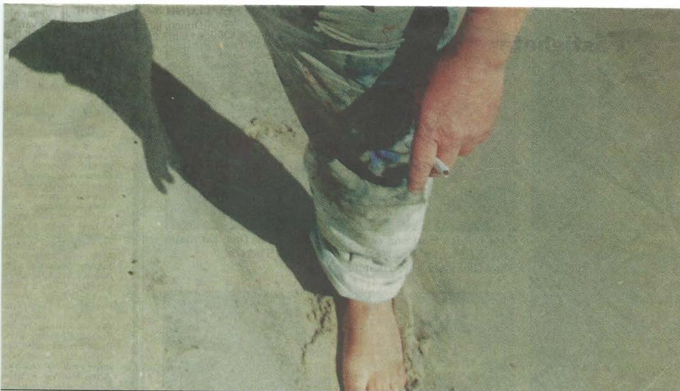
... och vida horisonter, som här vid havet nära hans älskade Maglehem.