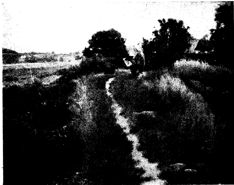
Stina Forssell: Målarinna i Maglehem.